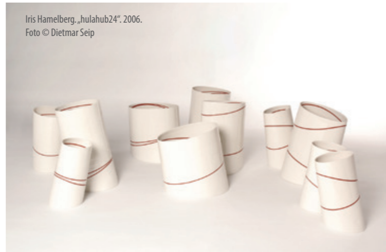
Iris Hamelberg, „hulahub24“. 2006.

Wir freuen uns, wenn Sie mitmachen und uns unterstützen!