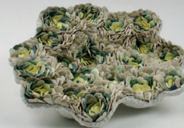
Verdant Bloom.